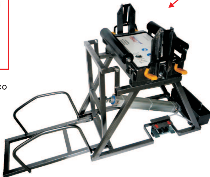
COD. 9005.09 DIVARICATORE UNIVERSALE PER PNEUMATICI MOD. THOR UNIVERSAL TYRE EXPANDER MOD. THOR