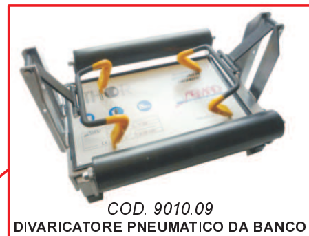
COD. 9010.09 DIVARICATORE PNEUMATICO DA BANCO PNEUMATIC BENCH TYRE EXPANDER