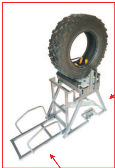
COD. 9015.09 BASE D'APPOGGIO THOR BASE