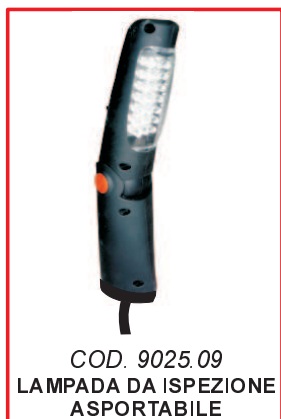
COD. 9025.09 LAMPADA DA ISPEZIONE ASPORTABILE REMOVABLE INSPECTION LAMP