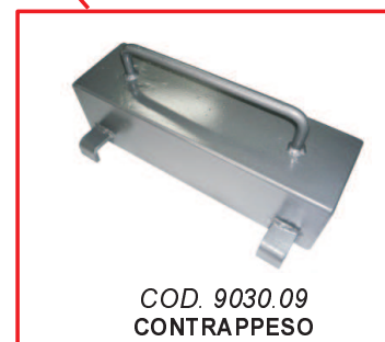
COD. 9030.09 CONTRAPPESO COUNTERWEIGHT